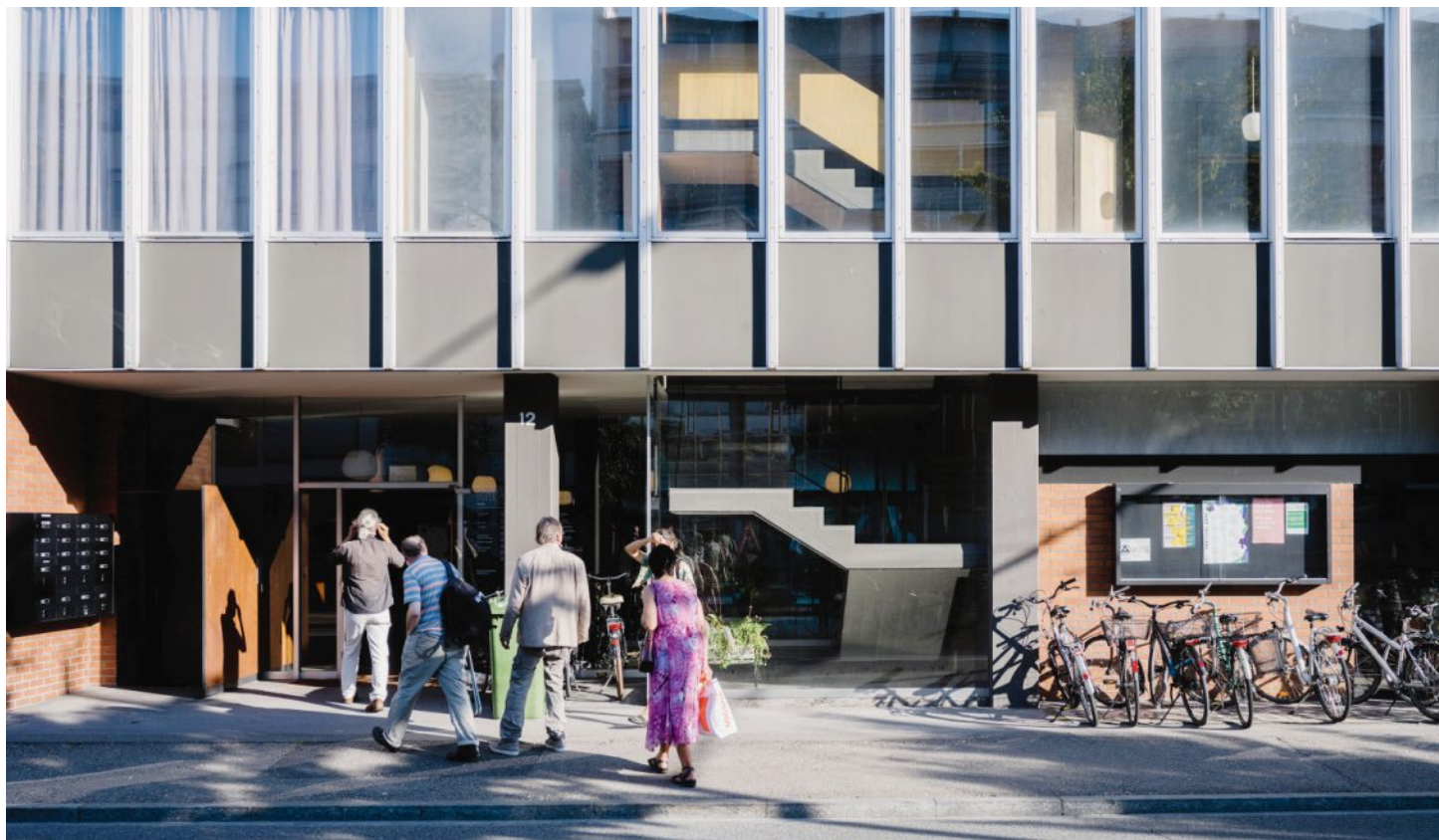
Plus de 90 membres d'«Axe Ouest – pas comme ça!» se sont réunis mardi soir à la Maison Farel. MATTHIAS KÄSER

Sur les 2000 membres que compte l'association d'opposants au projet initial de la branche Ouest de l'autoroute A5 à Bienne, plus de 90 ont pris part aux discussions entre 19 heures et 21h30 mardi soir, malgré les restrictions sanitaires. La dissolution du mouvement citoyen «Axe Ouest – pas comme ça!» a été au cœur des débats. Certains estimaient, en effet, que l'objectif principal